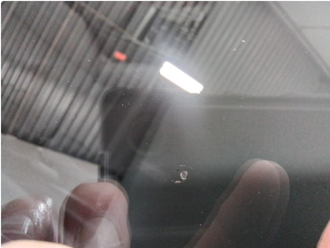
1.1 Steinsprut utenfor synsfelt