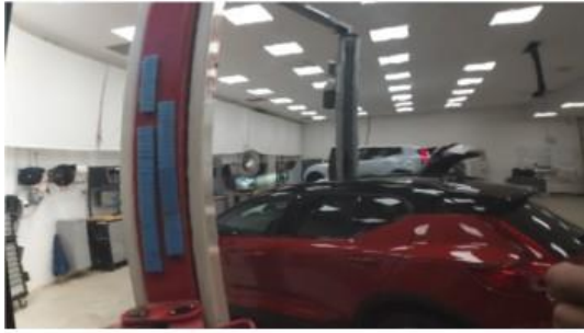
1.1 Liten bulk dør venstre bak