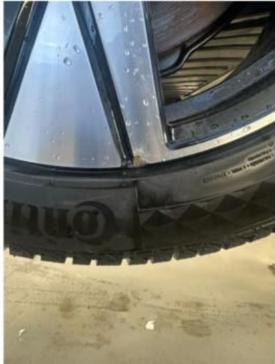
1.1 En vinterfelg litt kantkjørt