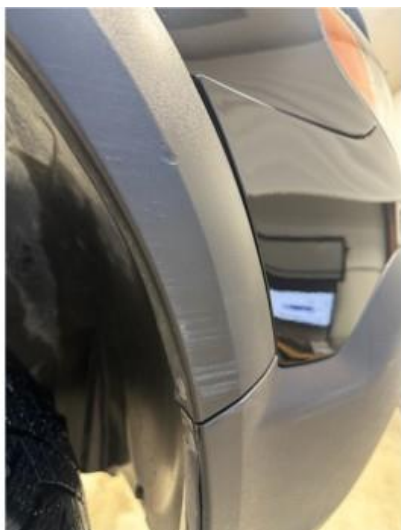
1.1 Litt oppripet på fanger høyre foran