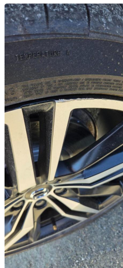
1.3 En sommerfelg litt kantkjørt