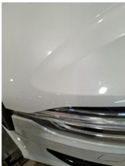
1.1 Noen steinsprut i panser. Ikke mer en normal slitasje