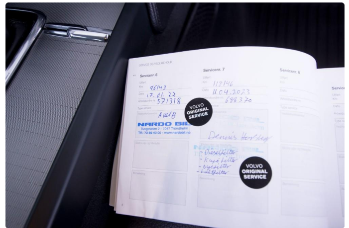
2.1 Fin historikk. Siste service utført 18.04.2024 på 135 645 km