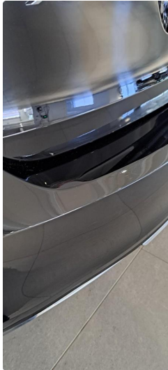
1.3 Liten bulk i fanger