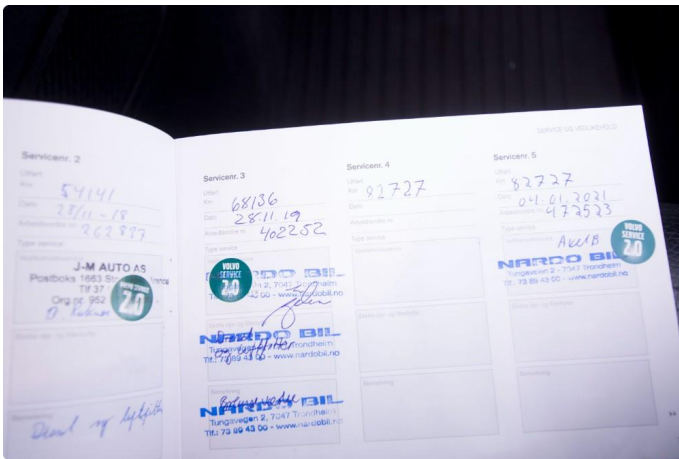
2.1 Fin historikk. Siste service utført 18.04.2024 på 135 645 km