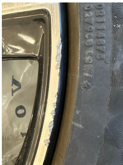
1.1 En sommerfelg litt kantkjørt