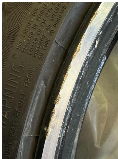
1.1 En sommerfelg litt kantkjørt