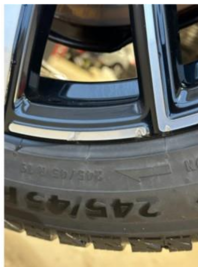
1.2 En vinterfelg litt kantkjørt