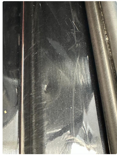
1.3 Liten bulk i døråpning venstre foran