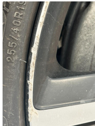
1.2 2 stk sommerfelger litt kantkjørt