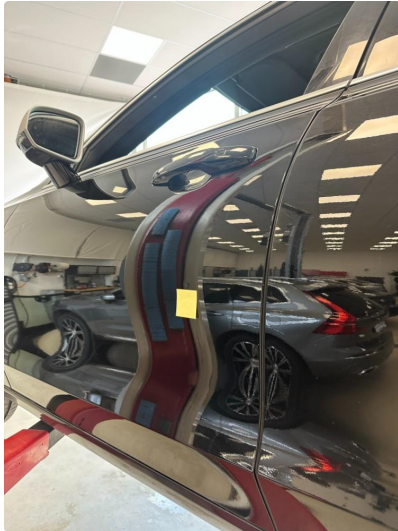
1.1 Noen små bulker på dør venstre foran og høyre foran