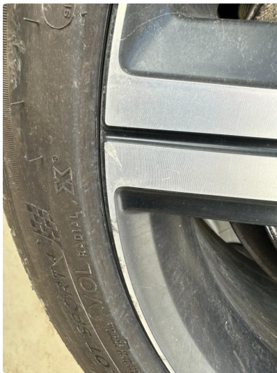
1.2 2 stk sommerfelger litt kantkjørt