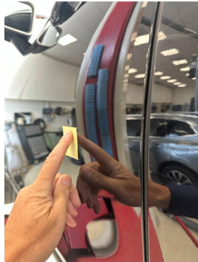
1.1 Noen små bulker på dør venstre foran og høyre foran