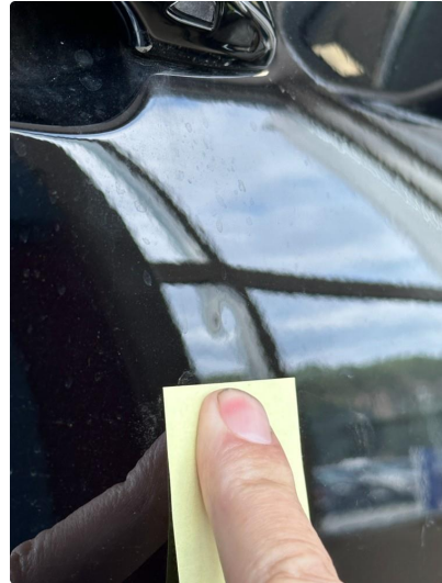
1.1 Noen små bulker på dør venstre foran og høyre foran