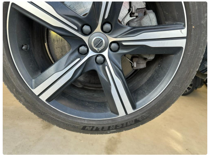
1.2 2 stk sommerfelger litt kantkjørt