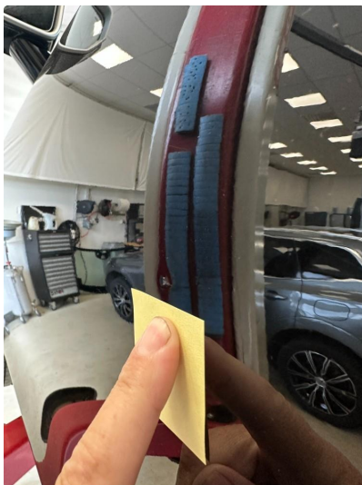
1.1 Noen små bulker på dør venstre foran og høyre foran