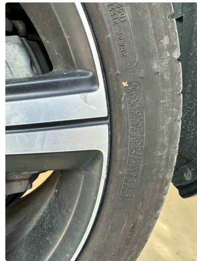
1.2 2 stk sommerfelger litt kantkjørt