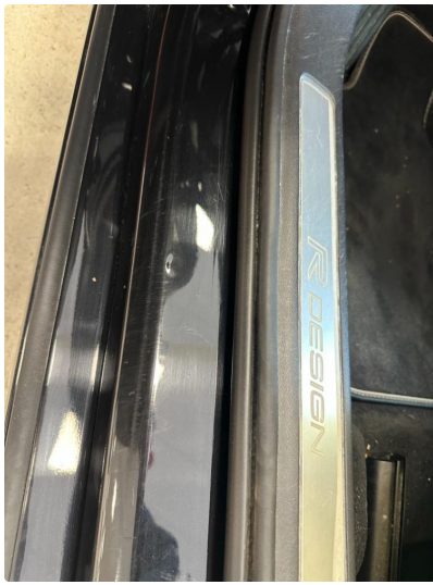
1.3 Liten bulk i døråpning venstre foran