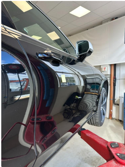
1.1 Noen små bulker på dør venstre foran og høyre foran