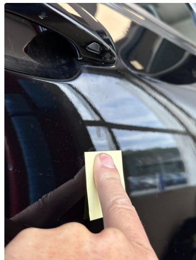
1.1 Noen små bulker på dør venstre foran og høyre foran