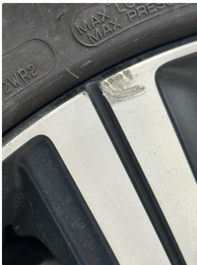
1.2 2 stk sommerfelger litt kantkjørt