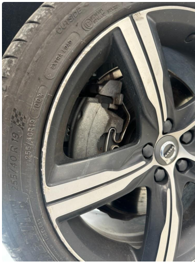
1.2 2 stk sommerfelger litt kantkjørt