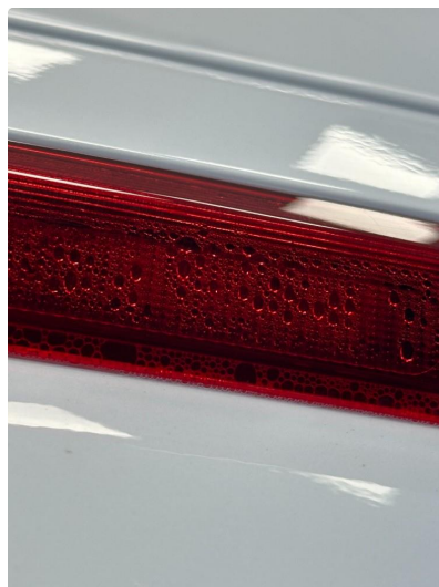
2.1 Litt dugg/fukt i bremselys bak