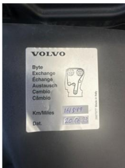
3.1 Reg.reim byttet 20.06.2023 på 161 349 km