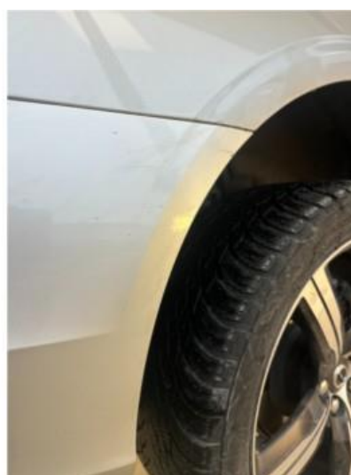
1.4 Noen svake riper i fanger høyre bak