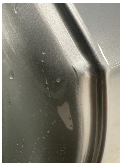
1.3 Litt slitt innsteg begge dører bak