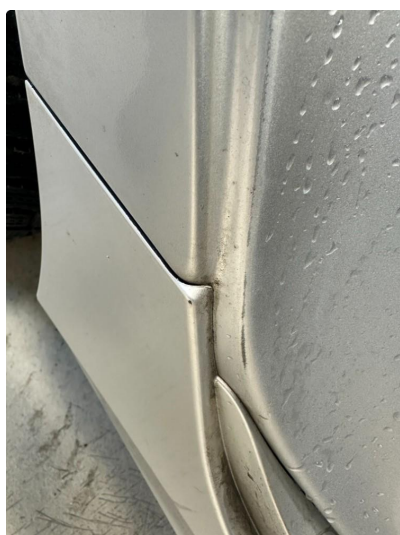
1.3 Litt slitt innsteg begge dører bak