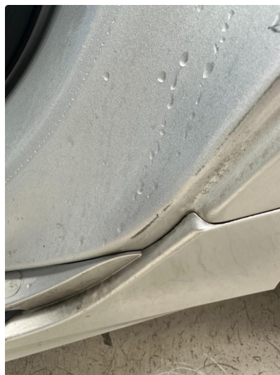
1.3 Litt slitt innsteg begge dører bak