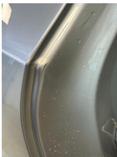
1.3 Litt slitt innsteg begge dører bak