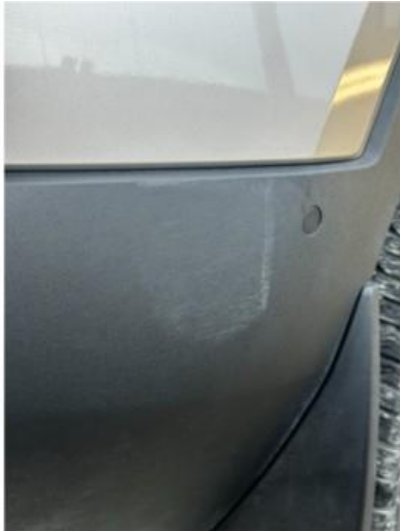
1.1 Noen riper i plastdel fanger høyre bak