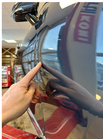
1.1 Liten ubetydelig p-bulk på dør høyre foran