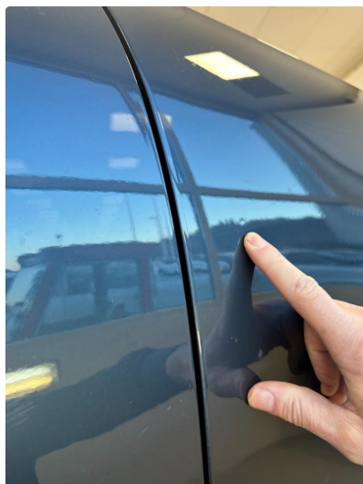
1.1 Liten ubetydelig p-bulk på dør høyre foran