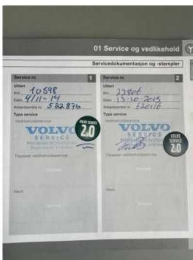
1.2 Veldig fin servciehistorikk