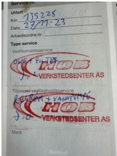
1.1 Reg.reim byttet 27.11.2023 på 135 228 km