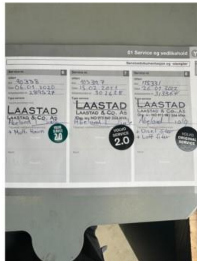
1.2 Veldig fin servciehistorikk