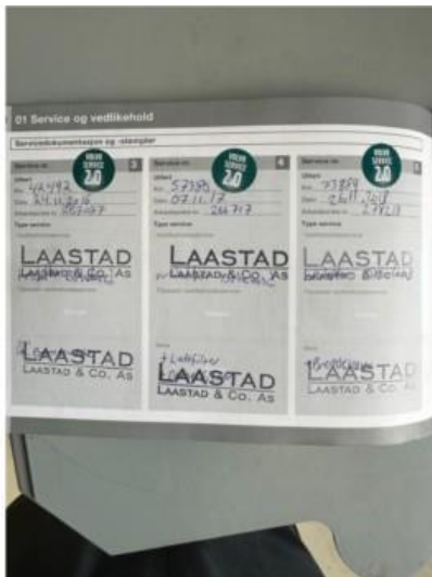
1.2 Veldig fin servciehistorikk