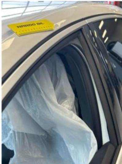
1.4 Bulk oppe på tak venstre side