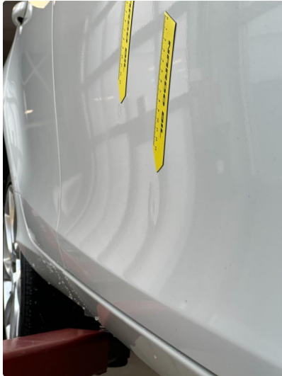
1.1 Noen bulker på dør høyre foran