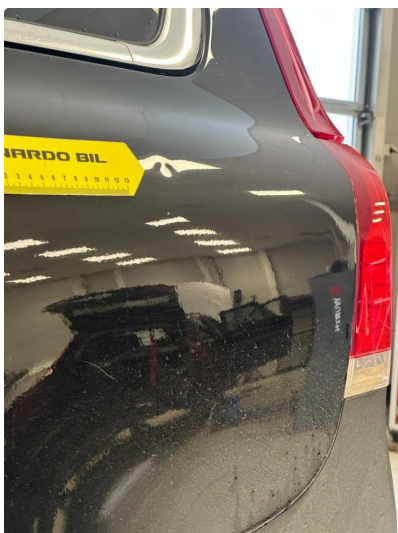
1.4 P-bulk skjerm venstre bak