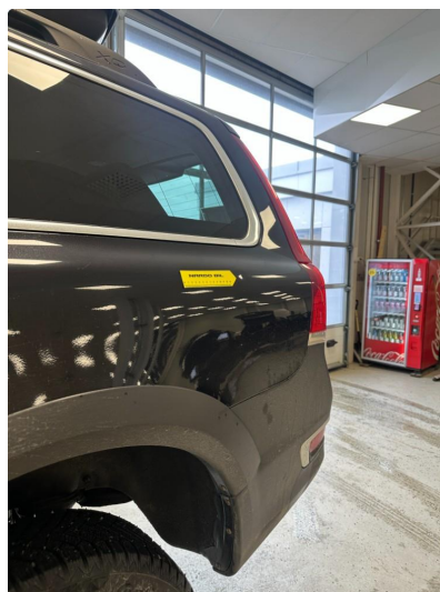
1.4 P-bulk skjerm venstre bak