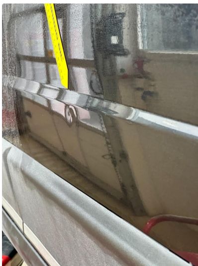
1.3 P-bulk i dør høyre foran