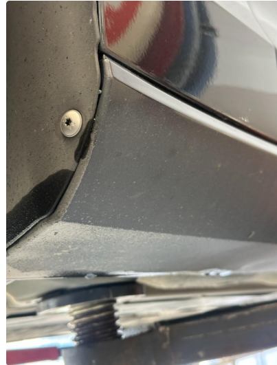
1.2 Noen matt lakk på kanaler begge sider