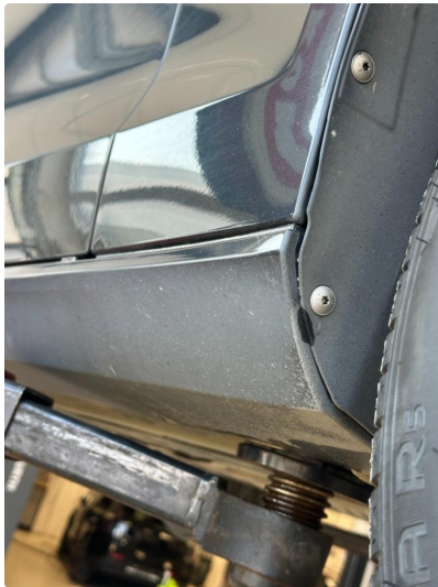
1.2 Noen matt lakk på kanaler begge sider