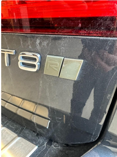
1.1 Lakk flasser på emblemer på bakluke.