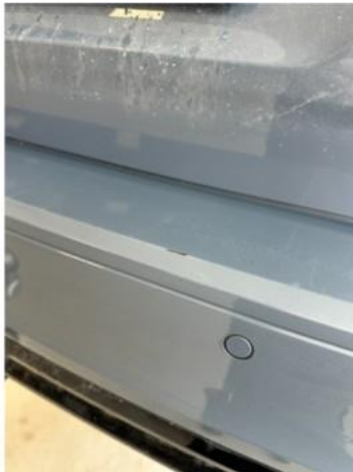
1.1 Lita ripe i lastesone fanger bak. Vil bli lakkert forenklet