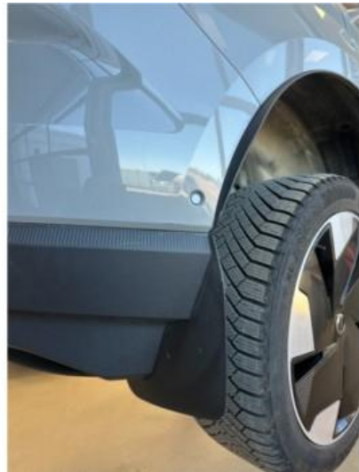
1.2 Ett par små riper i fanger høyre bak