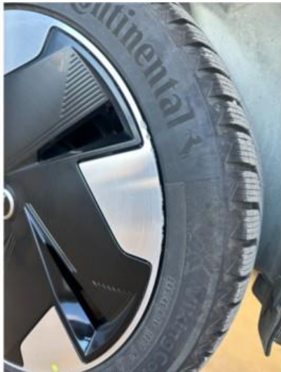
1.1 En vinterfelg litt kantkjørt