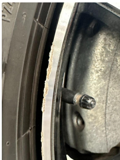
1.1 En sommerfelg litt kantkjørt