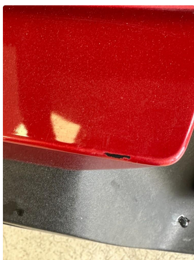
1.2 Noen riper i lastesone fanger bak. Lakkeres forenklet