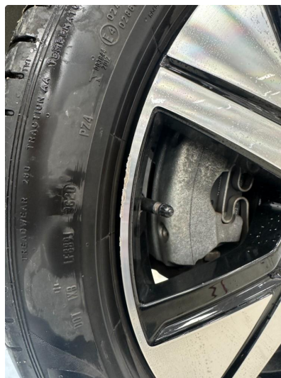
1.1 En sommerfelg litt kantkjørt