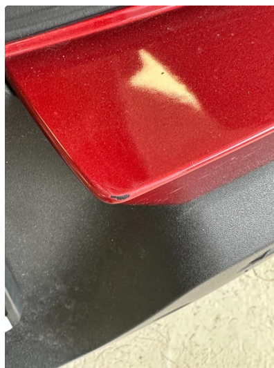
1.2 Noen riper i lastesone fanger bak. Lakkeres forenklet