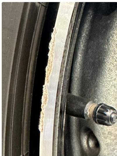
1.1 En sommerfelg litt kantkjørt