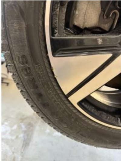
1.1 2 stk vinterfelger litt kantkjørt