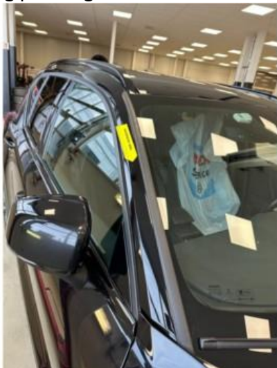
1.3 Liten steinsprut midt på tak + A-pilar høyre side. Lakkeres forenklet