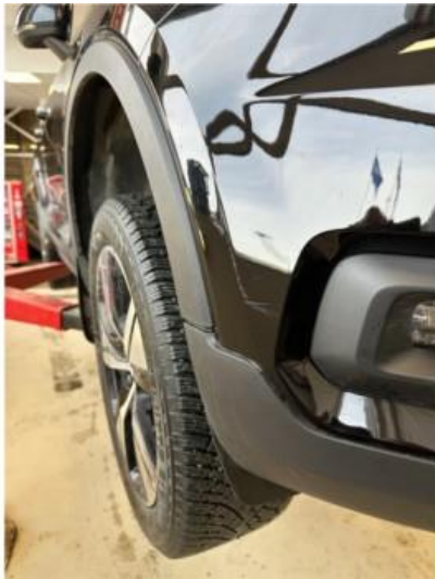
1.2 Noen riper i fanger høyre foran. Dempes med rubbing og polering