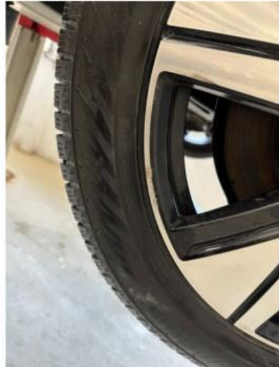
1.1 2 stk vinterfelger litt kantkjørt