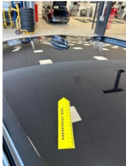
1.3 Liten steinsprut midt på tak + A-pilar høyre side. Lakkeres forenklet