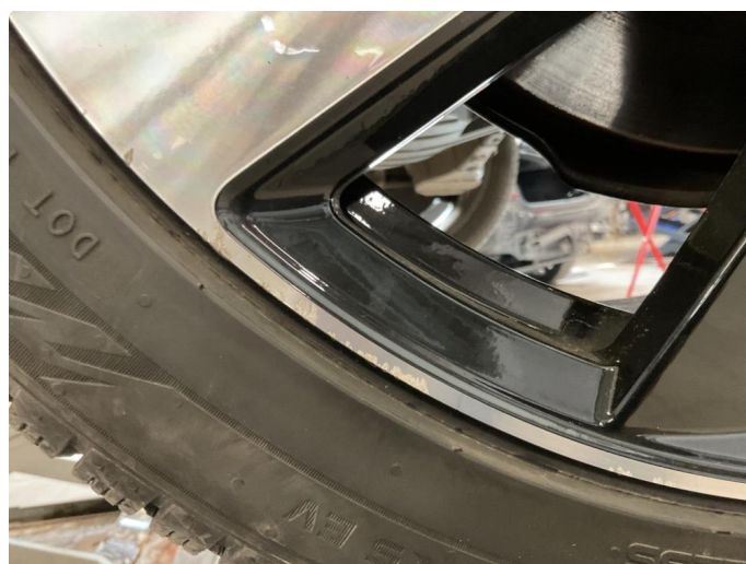
1.5 Kantkjørt felg