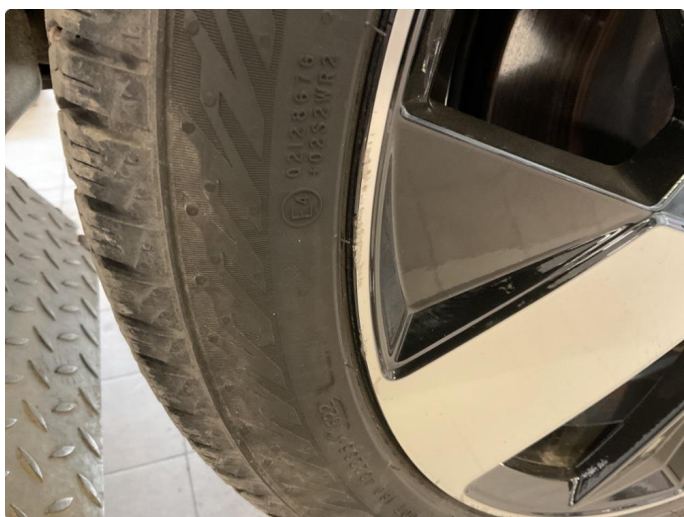
1.5 Kantkjørt felg