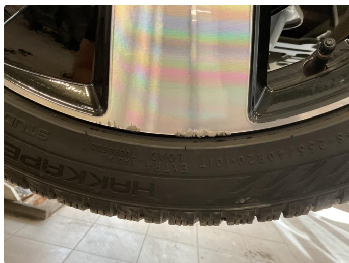
1.5 Kantkjørt felg