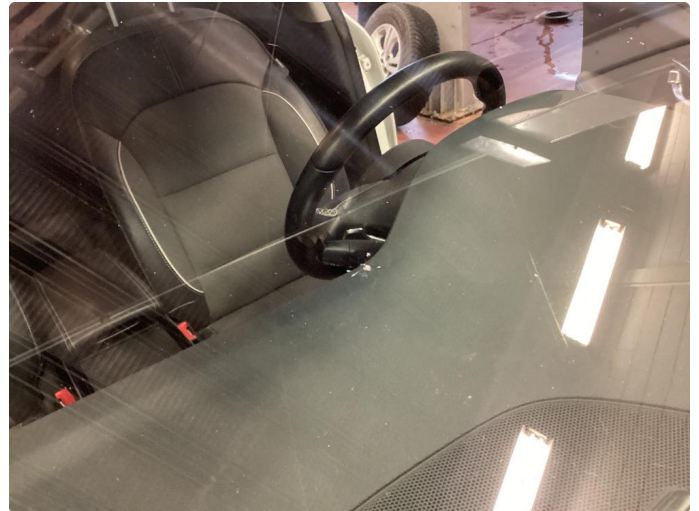
1.2 Noen steinsprut utenfor synsfelt.