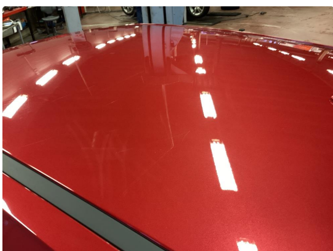
1.1 Litt småriper rundt hele bilen