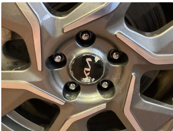
1.4 Noe oksidering på felger.