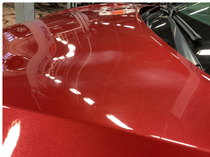
1.1 Litt småriper rundt hele bilen