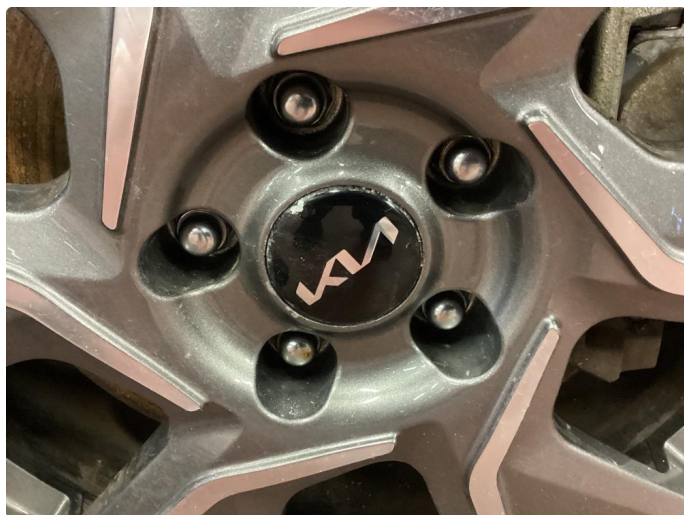
1.4 Noe oksidering på felger.