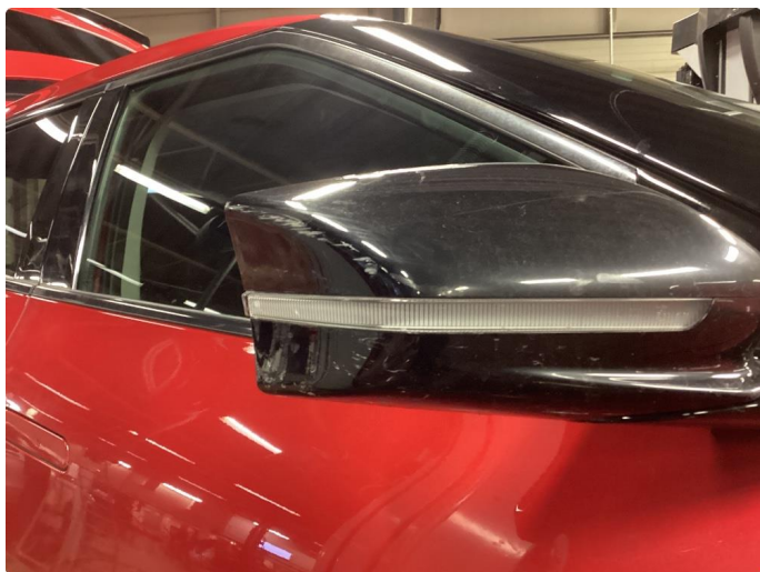
1.3 Små riper i speilhus