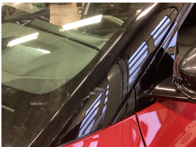
1.1 Litt småriper rundt hele bilen