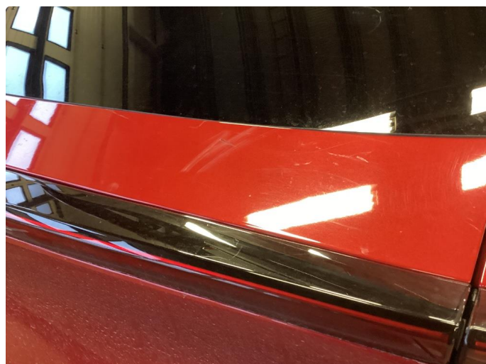
1.1 Litt småriper rundt hele bilen