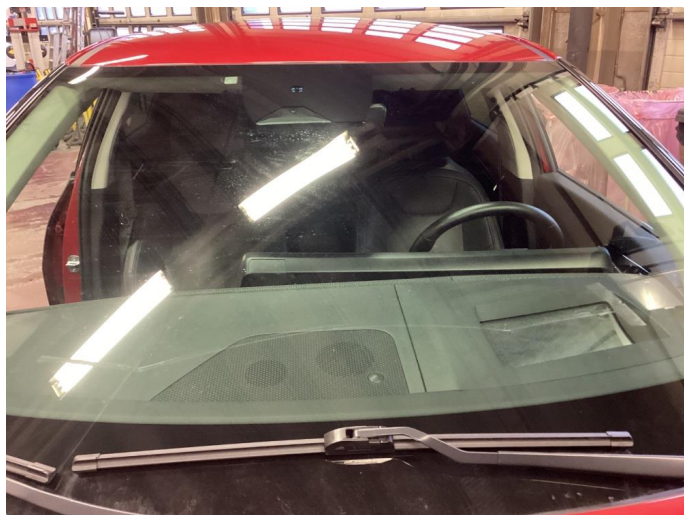
1.5 Steinsprut utenfor synsfelt