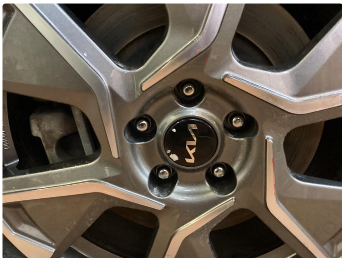
1.4 Noe oksidering på felger.