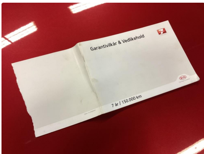
3.2 Servicehefte mangler halve forside.