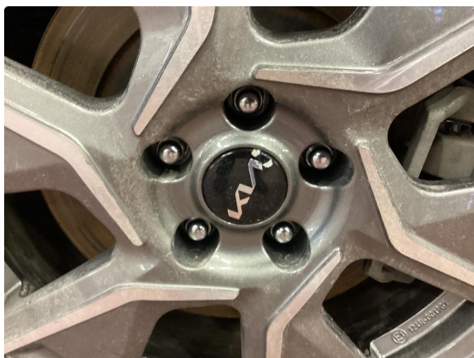
1.4 Noe oksidering på felger.