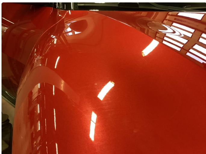
1.1 Litt småriper rundt hele bilen