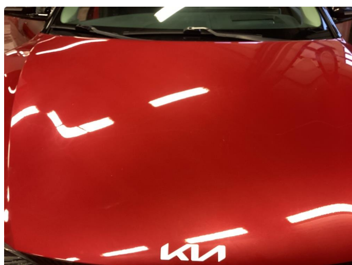
1.2 Noe steinsprut på panser