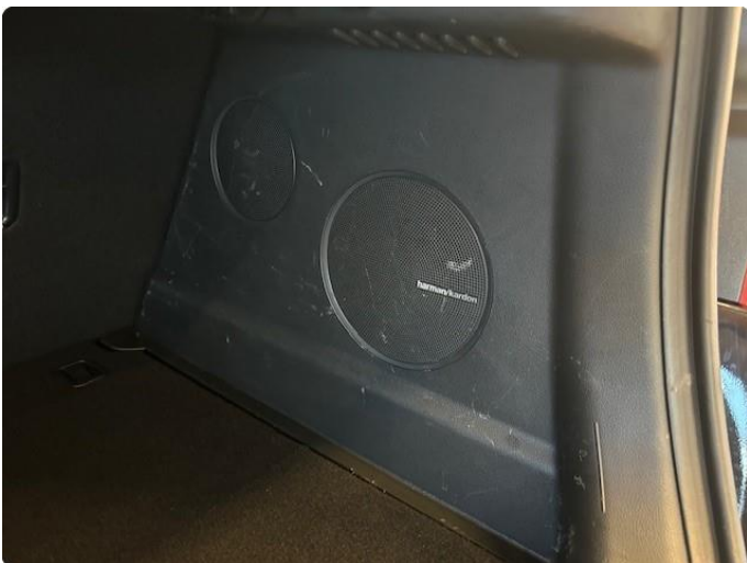
2.3 Slitasjemerker i bagasjerom