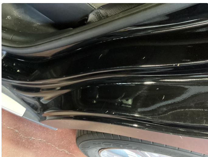
1.3 Bruksmerker i døråpning