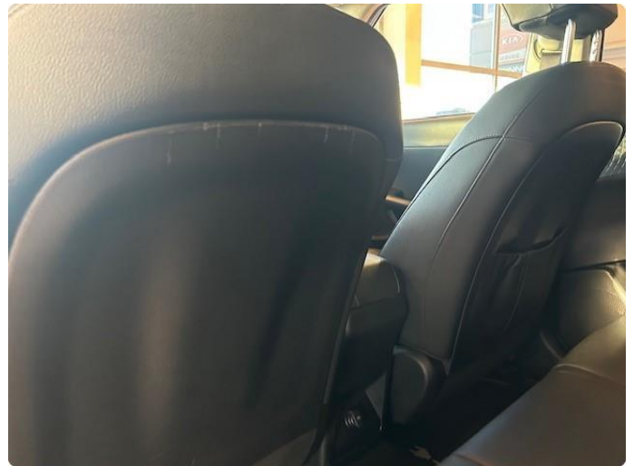
2.2 Slitasjemerker baksiden av førersetet