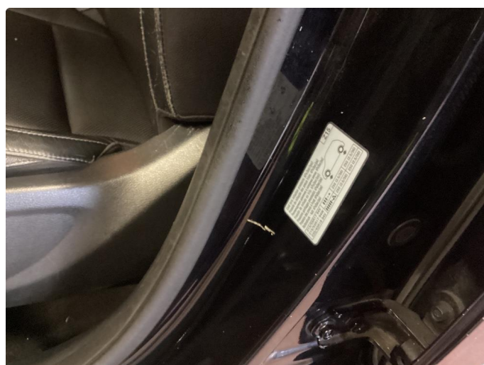
1.3 Bruksmerker i døråpning