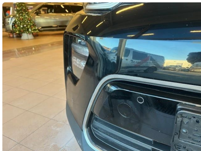
1.1 En del steinsprut. Spesielt i front. Noen små riper rundt hele bilen. Panser er nylakkert.