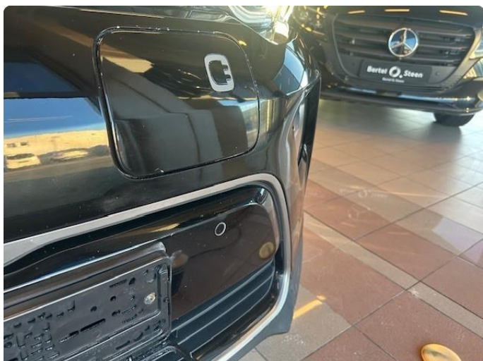
1.1 En del steinsprut. Spesielt i front. Noen små riper rundt hele bilen. Panser er nylakkert.