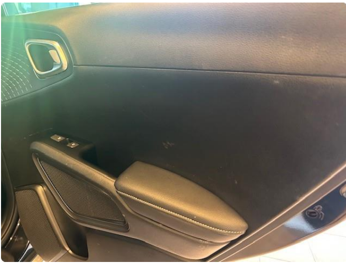
2.1 Slitasjemerker på dørtrekk i baksetet og bakluke