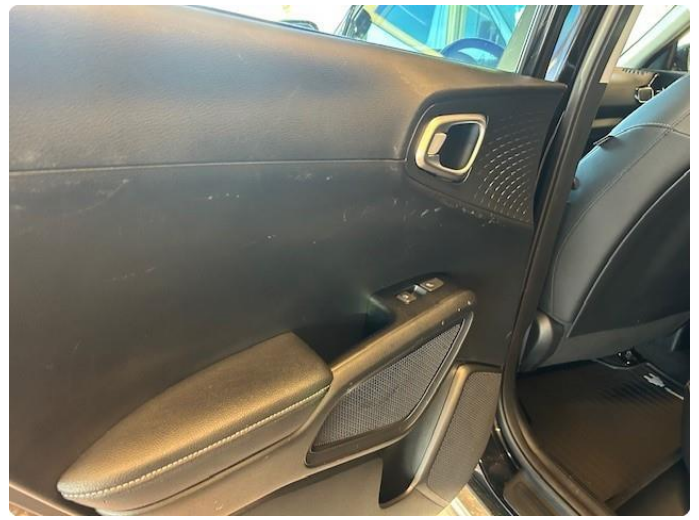
2.1 Slitasjemerker på dørtrekk i baksetet og bakluke