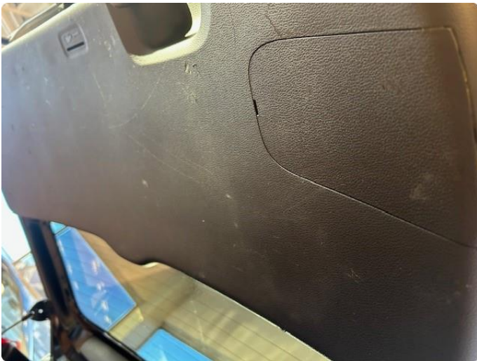
2.1 Slitasjemerker på dørtrekk i baksetet og bakluke