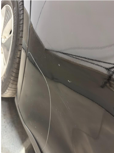
1.1 Generell bruksslitasje