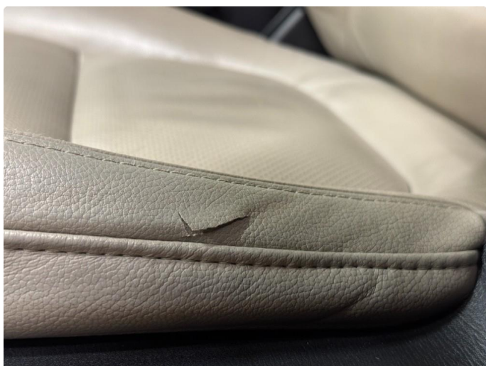
2.1 Hull / rift i setetrekk