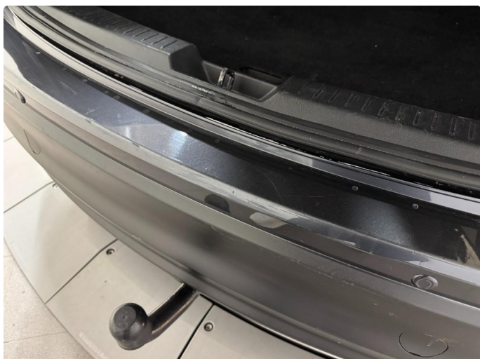
1.1 Bruksslitasje terskel