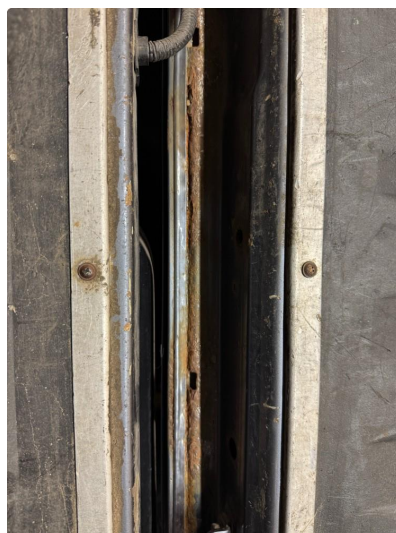
1.2 Rust i fals