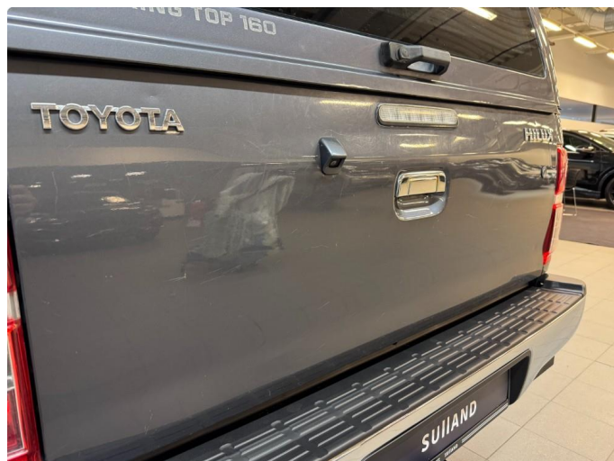
1.1 Generell bruksslitasje, riper, steinsprang etc