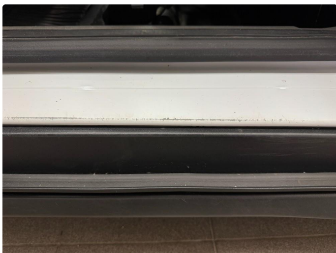
1.2 Bruksslitasje innsteg