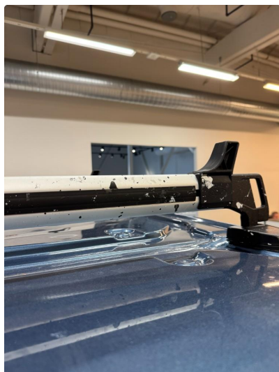
1.1 Malings-søl på takstativ