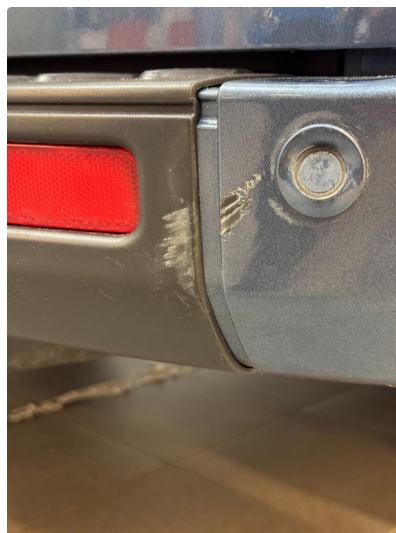
1.2 Liten skrape i plast