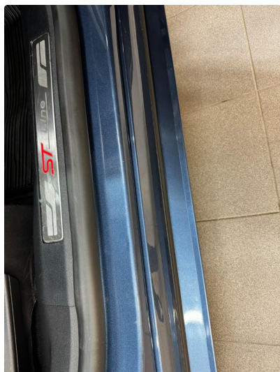
1.1 Bruksslitasje terskler