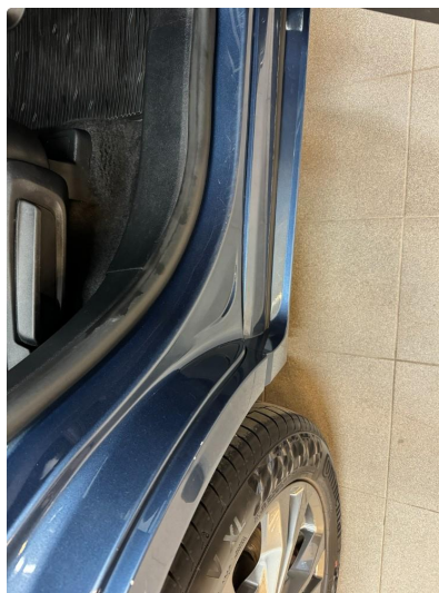
1.1 Bruksslitasje terskler