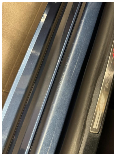
1.1 Bruksslitasje terskler