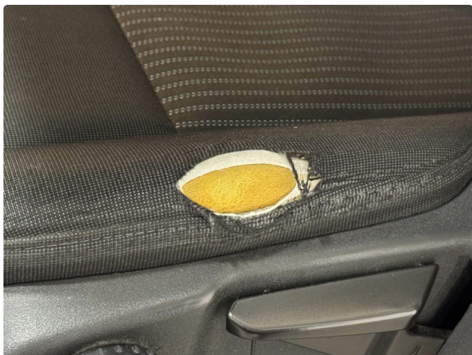
2.1 Slitt hull i setetrekk