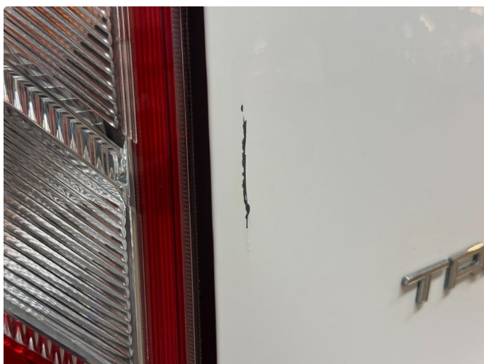
1.3 Bulk med lakkskade