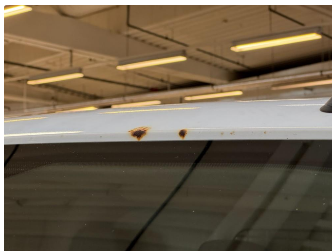
1.6 Steinsprang med rust