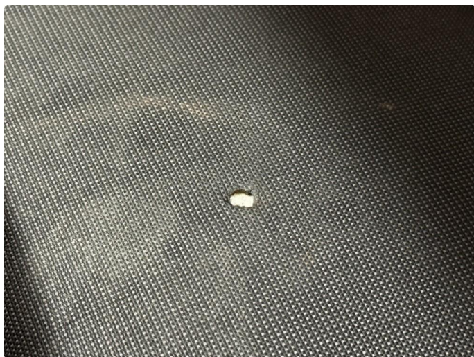
2.2 Hull i setetrekk