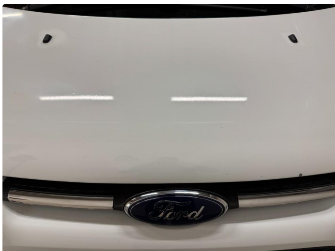
1.1 Bulk og steinsprang