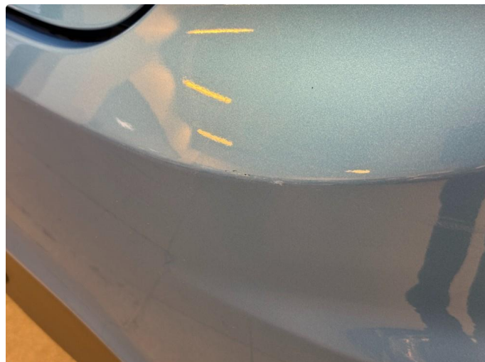
1.2 Noen småmerker i bakfanger