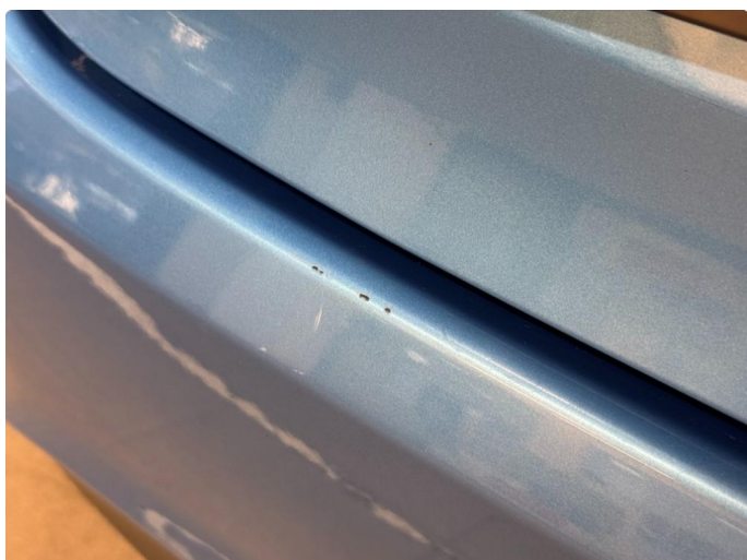
1.2 Noen småmerker i bakfanger