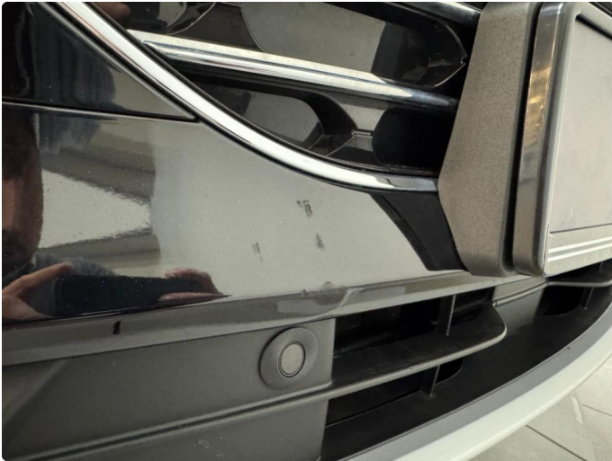
1.3 Lite sår i plasten