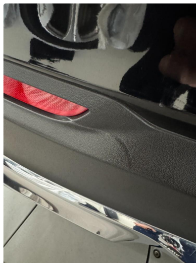
1.1 Diverse bruksmerker