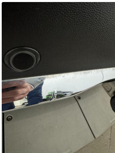
1.1 Diverse bruksmerker