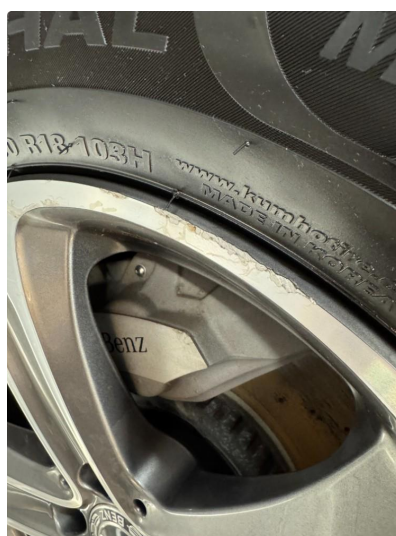
1.3 Kantkjørte felger