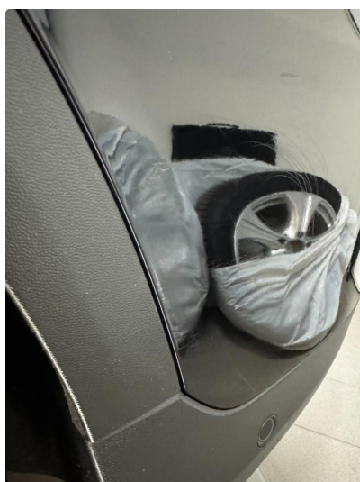
1.1 Diverse bruksmerker