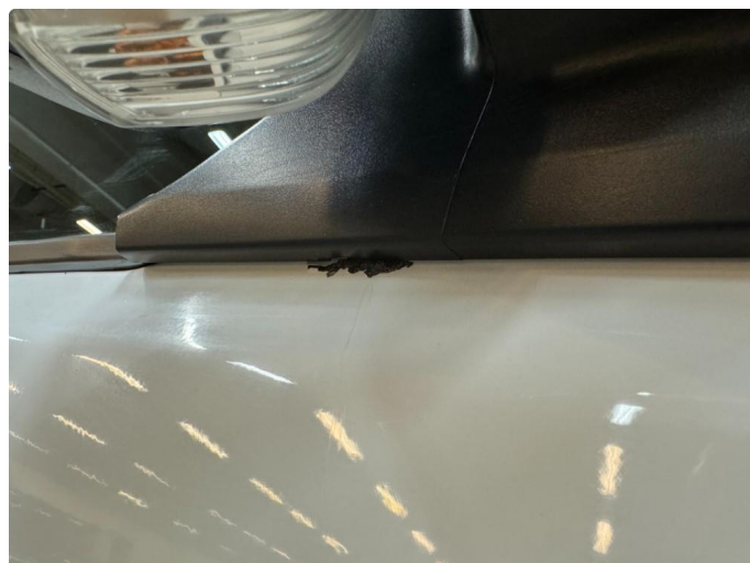
1.2 Lakklipp med rust