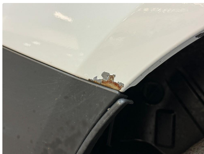
1.5 Lakklipp med rust