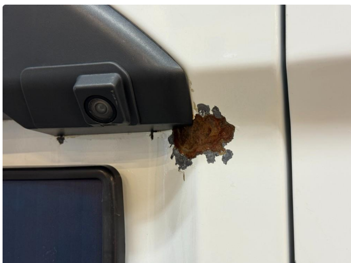
1.3 Lakklipp med rust