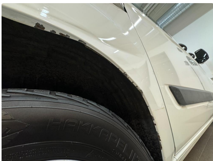
1.5 Lakklipp med rust