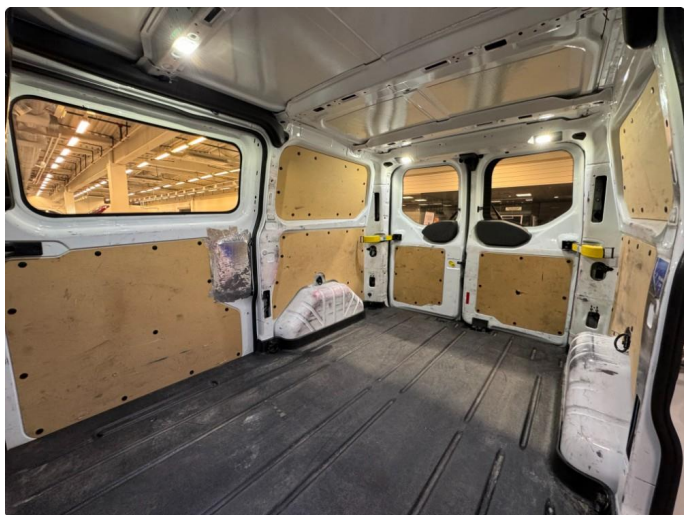
2.2 Bruksslitasje, arbeidsbil