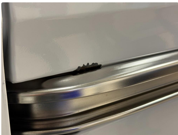
1.8 Diverse lakkslipp / rust