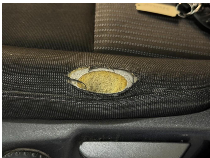
2.1 Hull i setetrek