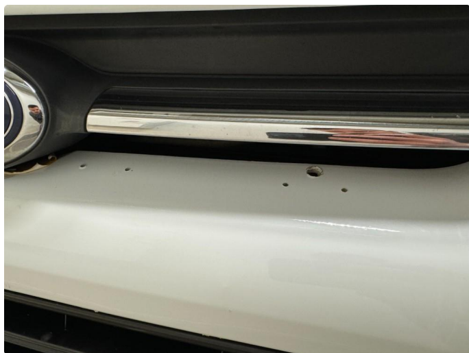
1.7 Hull etter varsellys