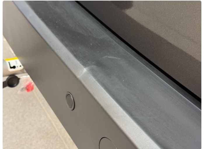
1.2 Bruksmerker innlastning bak