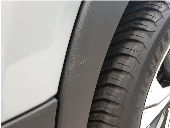
1.1 Skjermutbygger skadet