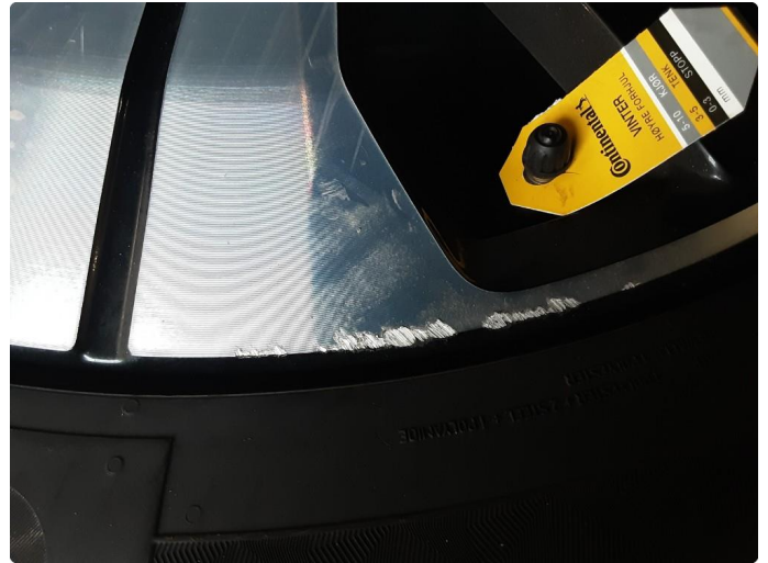
1.2 Kantskjørt felg