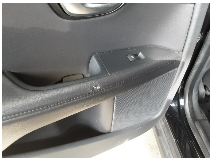
2.1 Merke på dørtrekk bak begge sider