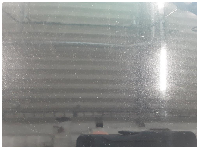
1.1 Noe steinsprut