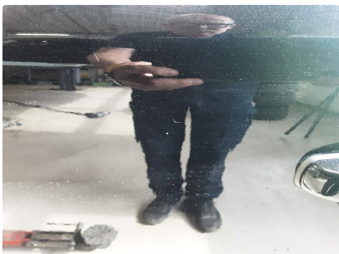
1.3 Noe steinsprut