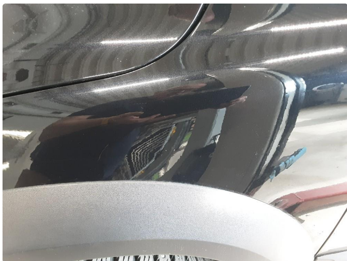
1.3 Noe steinsprut