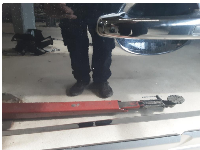
1.3 Noe steinsprut