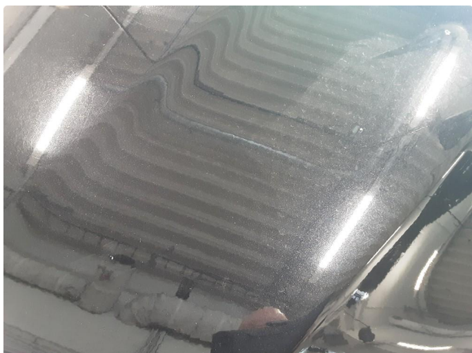
1.1 Noe steinsprut