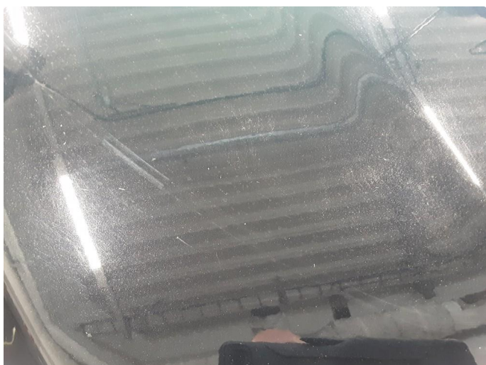
1.1 Noe steinsprut