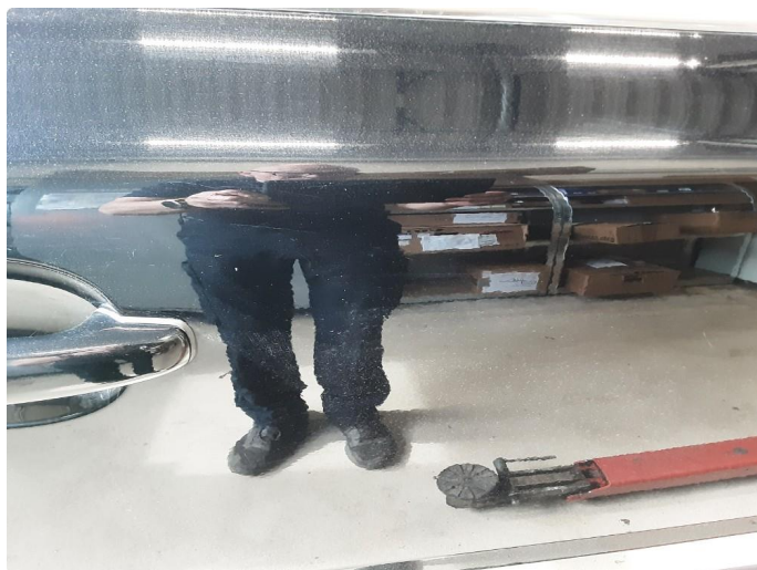
1.3 Noe steinsprut