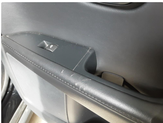
2.1 Merke på dørtrekk bak begge sider