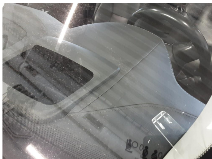
1.3 Noe steinsprut