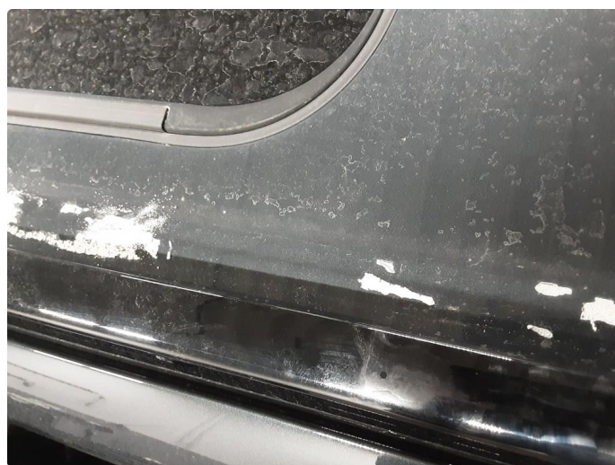
1.4 Øvrige feil