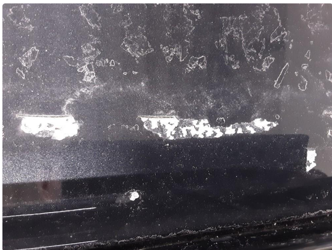
1.5 Øvrige feil