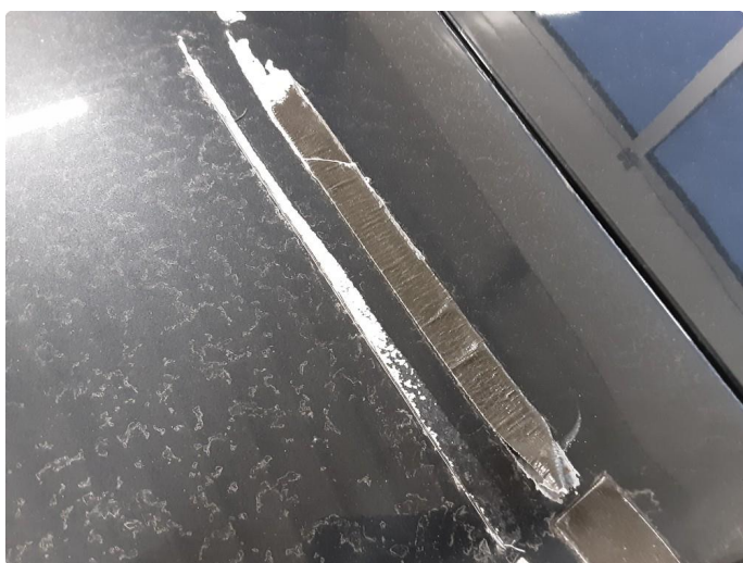
1.4 Øvrige feil