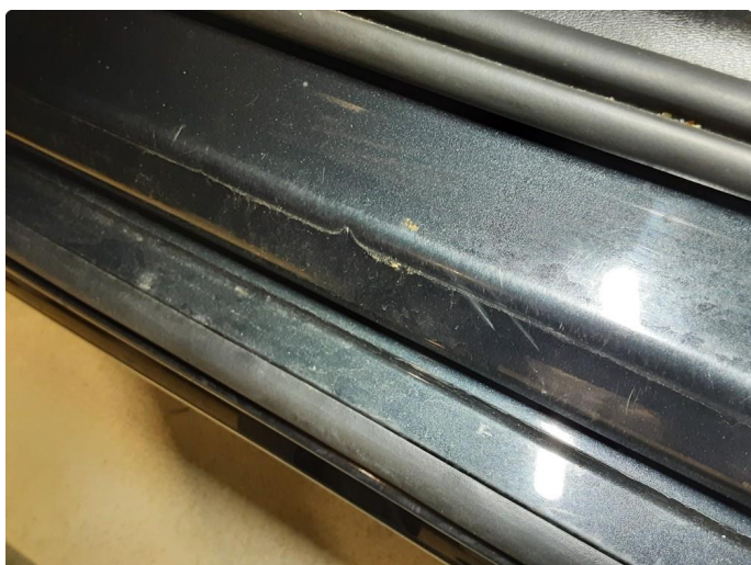
1.2 Noen riper og småbulker