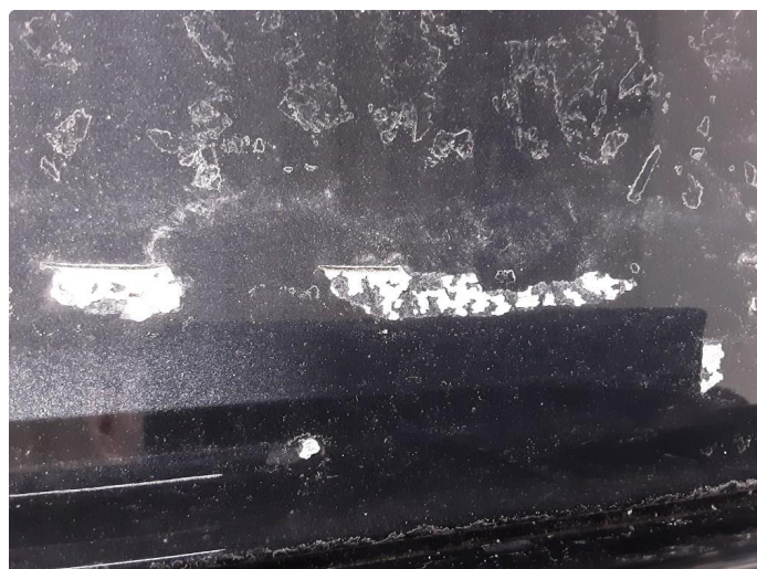
1.4 Øvrige feil