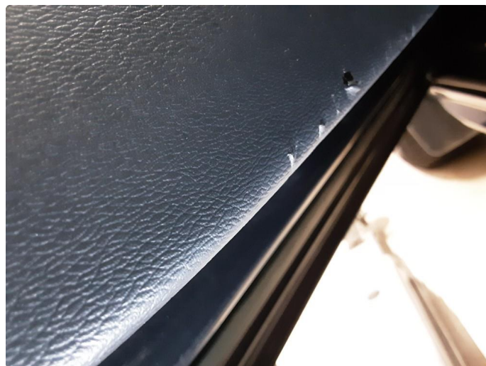
3.1 Skadet/merker etter utstyr