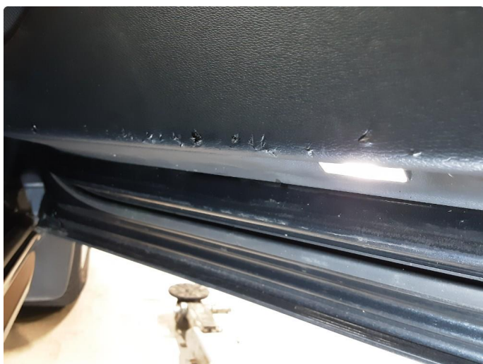
3.1 Skadet/merker etter utstyr