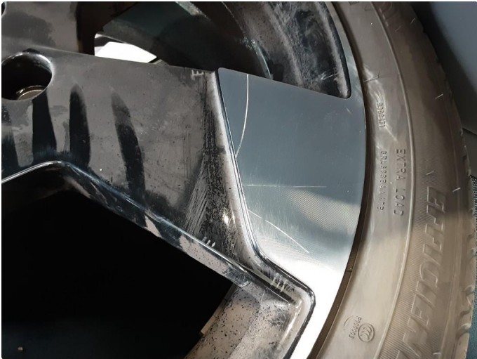
1.1 Ripe (r) gjennom lakk