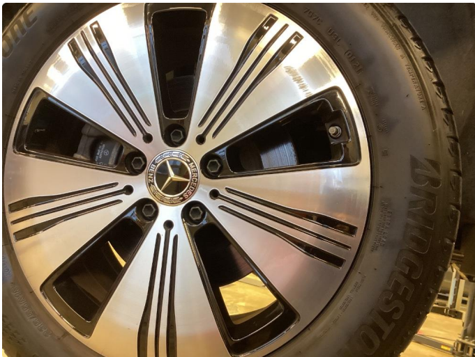
1.1 Noe kantkjørt felg