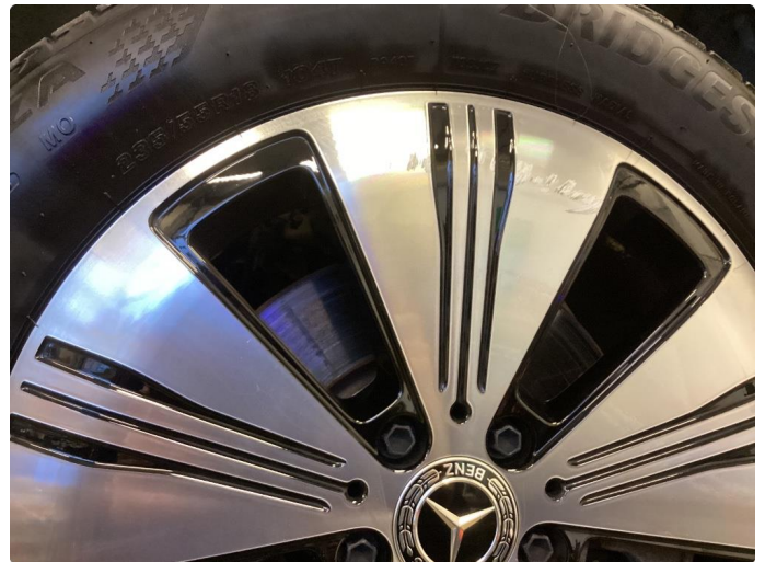
1.1 Noe kantkjørt felg