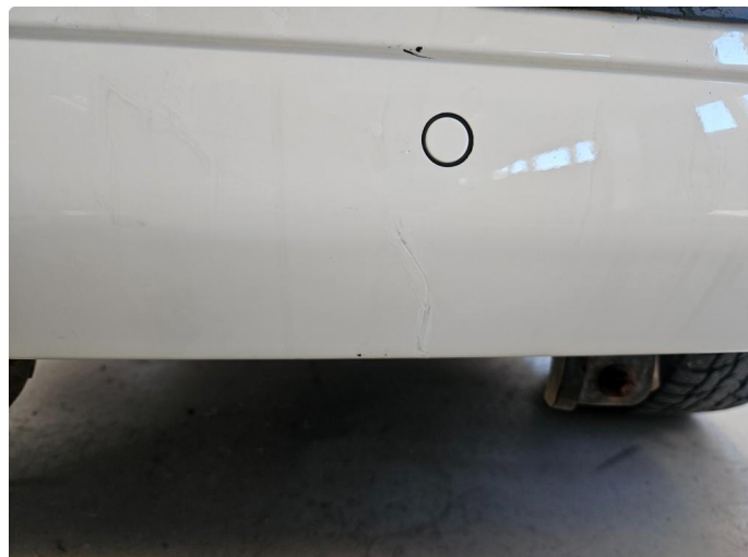
1.1 Sprekker i lakk, og flasset gummi beskyttelse