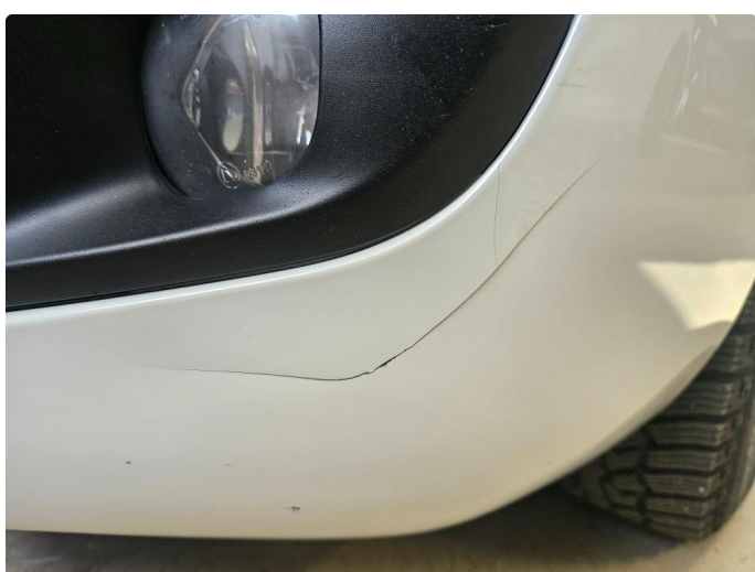
1.2 Sprekk i frontfanger