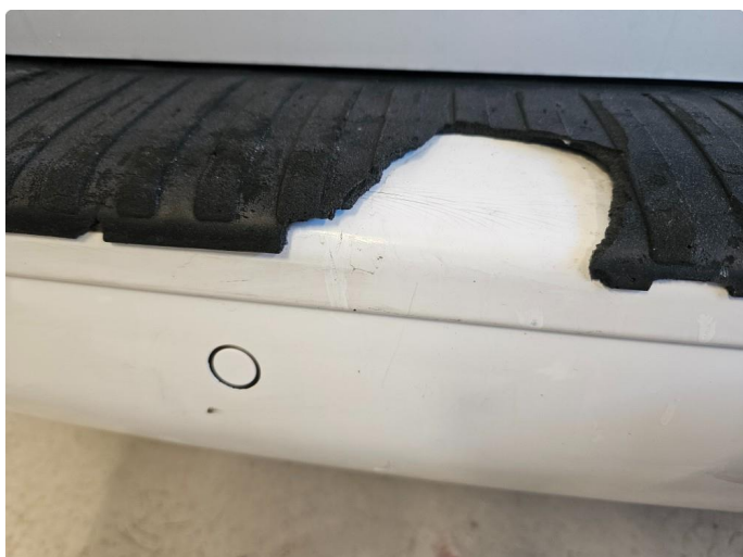
1.1 Sprekker i lakk, og flasset gummi beskyttelse