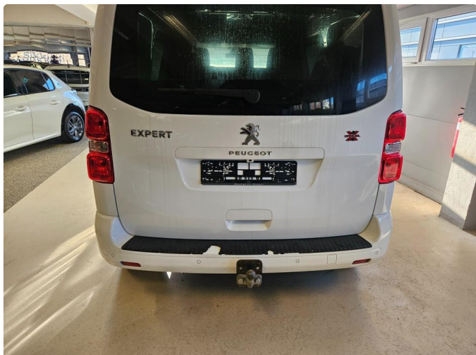
1.1 Sprekker i lakk, og flasset gummi beskyttelse