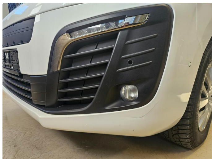
1.2 Sprekk i frontfanger