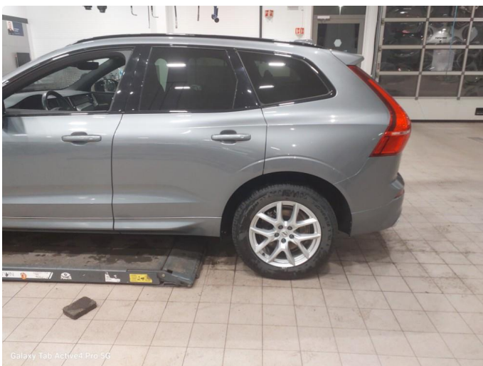
Galaxy Tab Active4 Pro 5G