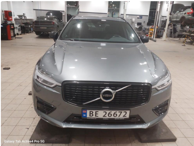
Galaxy Tab Active4 Pro 5G