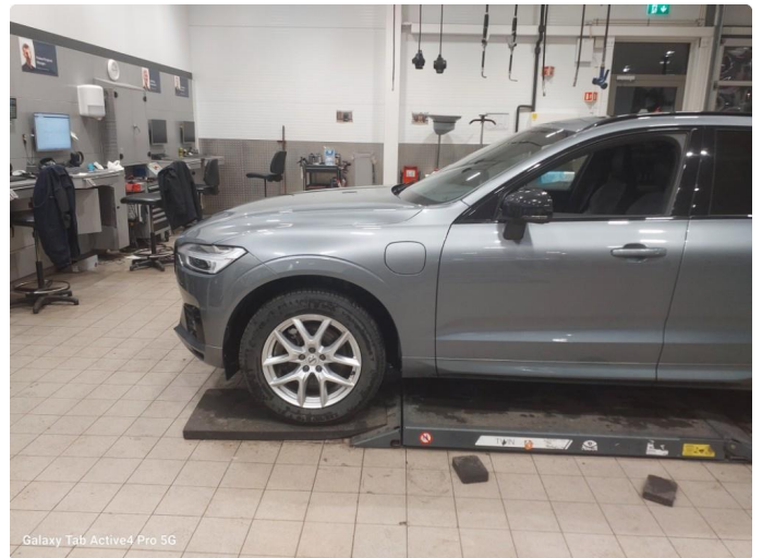
Galaxy Tab Active4 Pro 5G