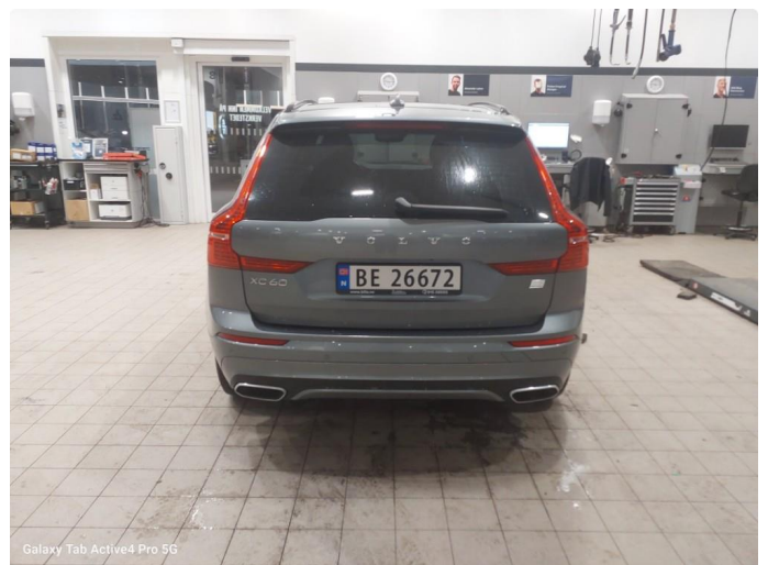
Galaxy Tab Active4 Pro 5G