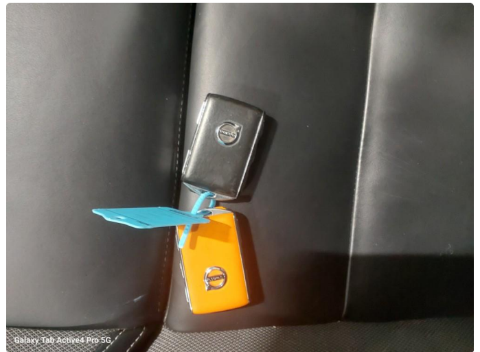
Galaxy Tab Active4 Pro 5G