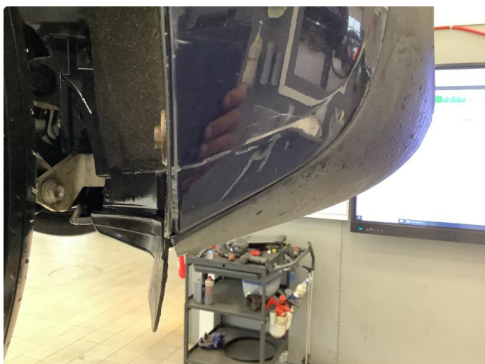
1.1 Noen små merker i lastesone støtfanger bak