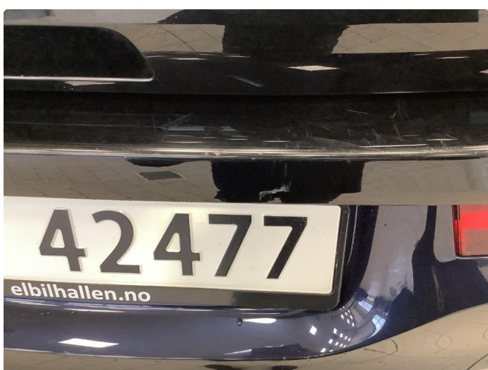
1.2 Liten ripe hs støtfanger foran