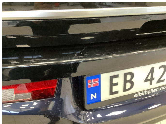
1.2 Liten ripe hs støtfanger foran