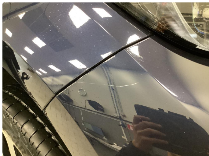
1.1 Noen små merker i lastesone støtfanger bak