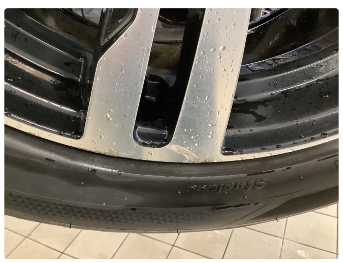
1.1 Noe bruksslitasje på vinterfelger