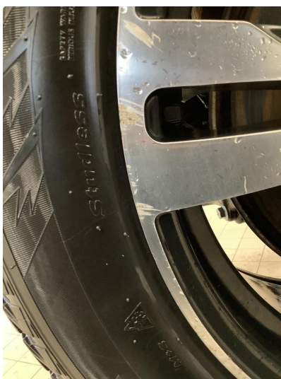
1.1 Noe bruksslitasje på vinterfelger