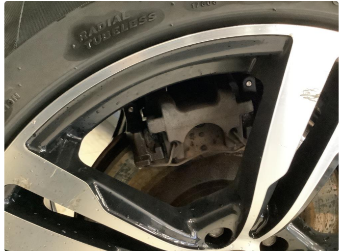
1.1 Noe bruksslitasje på vinterfelger