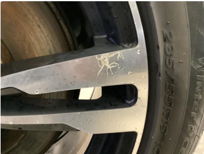
1.1 Noe bruksslitasje på vinterfelger