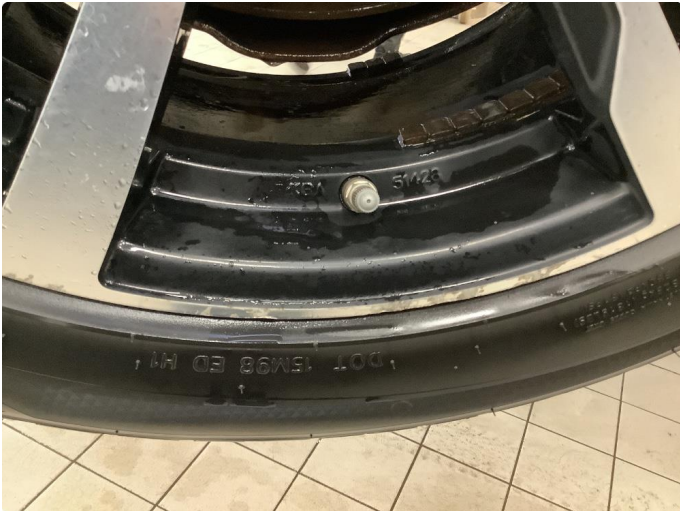
1.1 Noe bruksslitasje på vinterfelger