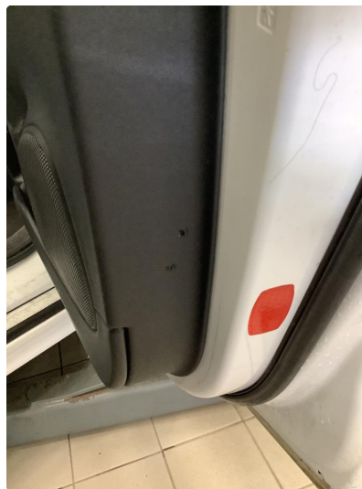
2.2 Noe bruksmerker