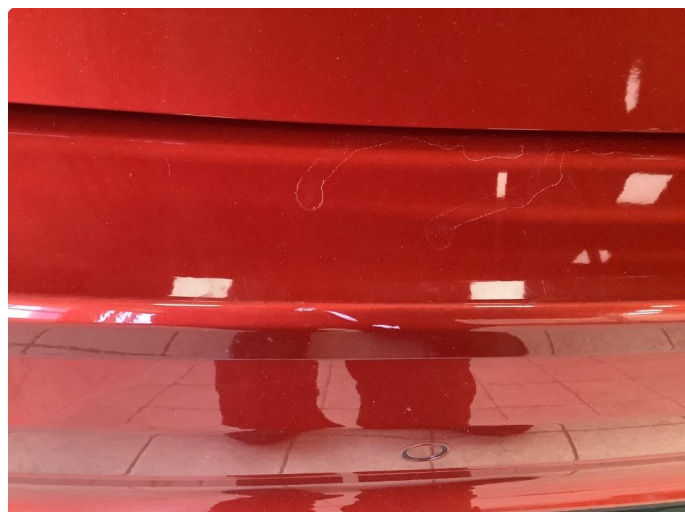
1.1 Noen bruksmerker i lastesone bak.