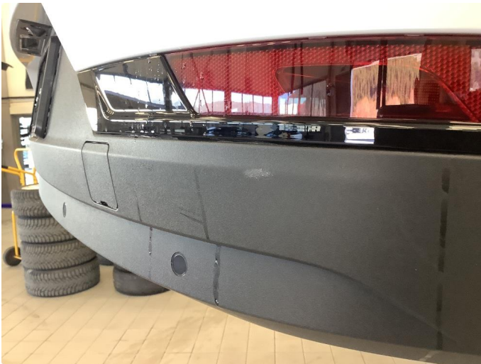
1.1 Liten skrubbskade høyre hjørne bak.