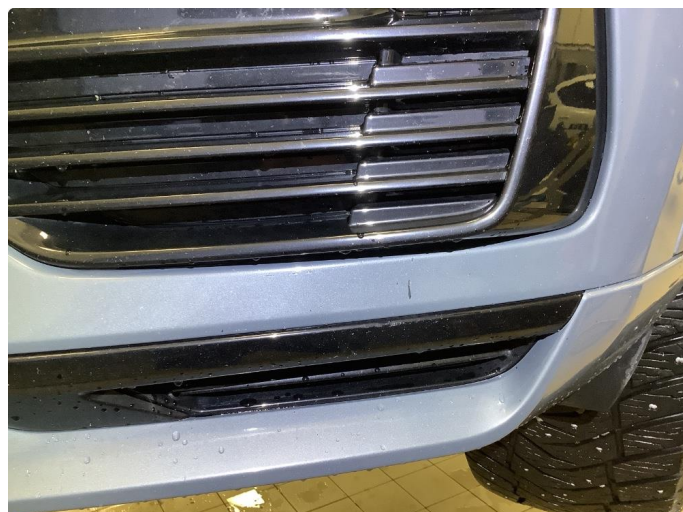
1.2 Små riper venstre side