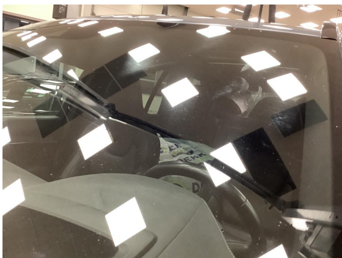
1.3 Litt bruksslitasje