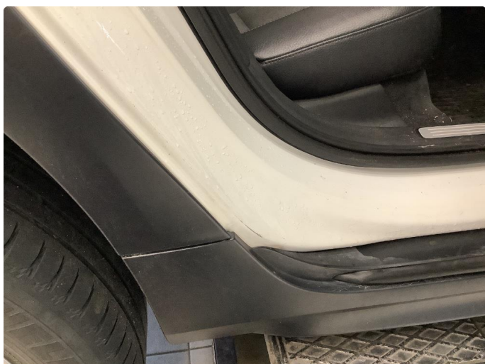
1.3 Noe lakkslitasje i døråpning