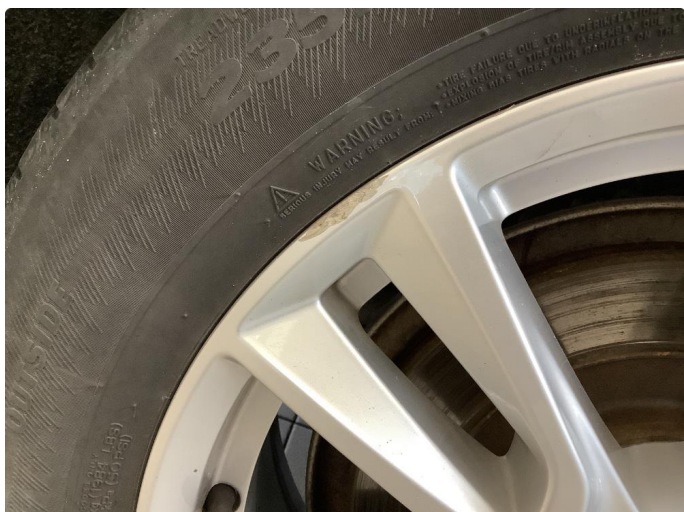
1.1 Litt sår i en sommerfelg og en vinterfelg