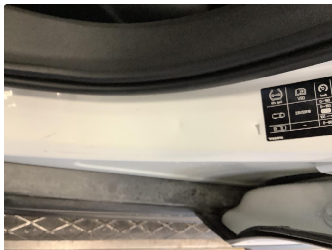
1.4 Liten bulk i døråpning