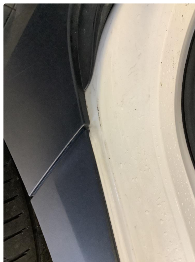
1.2 Noe lakkslitasje i døråpning